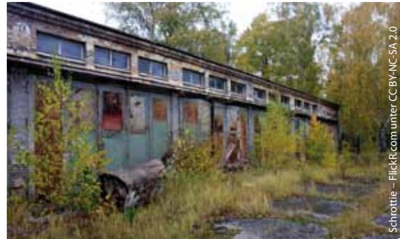
Gute Ideen sind gefragt, damit die Liegenschaften nicht verfallen

Als Konversionsbeauftragter der Landtagsfraktion besuche ich nacheinander die betroffenen Kommunen und lasse mich vor Ort informieren. Ihr könnt mich auch gern ansprechen und einen Termin vereinbaren.