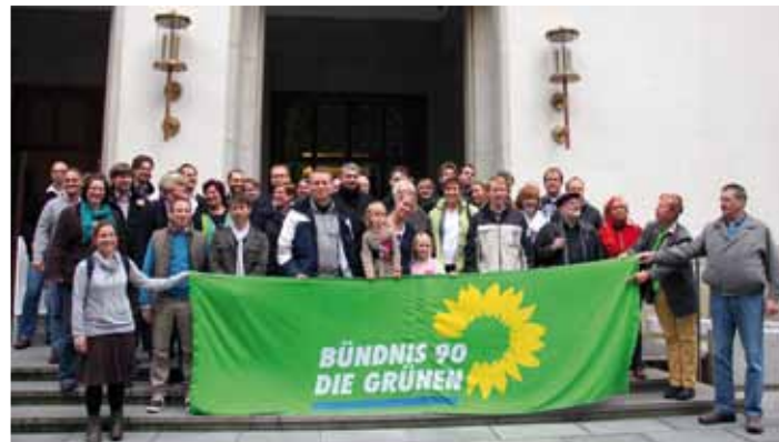
Die Teilnehmer_innen des Grünen Neumitgliedertreffens. Inzwischen haben die Grünen in Schleswig-Holstein über 2000 Mitglieder.