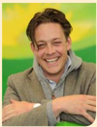
Dr. Konstantin von Notz, Innen- und Netz- politischer Sprecher Bündnis 90/Die Grünen

Neben den „Bundestrojanern“ und den schlimmen, neuen Erkenntnissen zu rassistischen Morden in Deutschland, beschäftigt sich die Innen- und Netzpolitik momentan unter anderem auch mit dem „Datenschutz in sozialen Netzwerken“ und der Suche nach neuen Regelungen zum Schutz von HinweisgeberInnen („WhistleblowerInnen“).