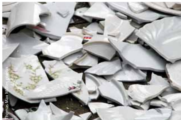
Was diese Regierung in kurzer Zeit an Porzellan zerschlägt, ist unfassbar

Kitas sollen als Ausgleich jährlich 10 Millionen Euro mehr vom Land bekommen. Doch während die Einsparung des beitrags-