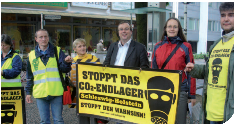
Ein großer Erfolg - deshalb muss der Protest weitergehen

Montag, 15.11.2010 • 19:00 Uhr Euer Thema! Vorschläge an: ingrid.nestle@wk.bundestag.de