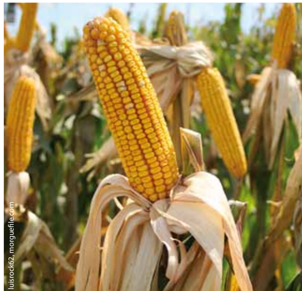
Mit der zunehmenden „Vermaisung“ werden andere, für Umwelt und Klima wirksamere Entwicklungen verhindert

Mit unserem Landtags-Antrag „Biomasse nachhaltig nutzen“ wollen wir erreichen, dass die Landesregierung über eine Bundesratsinitiative Änderungen im EEG und im Baugesetzbuch erwirkt. Nur dezentral, vielfältig und an die natürlichen Bedingungen angepasst kann Biomassenutzung einen