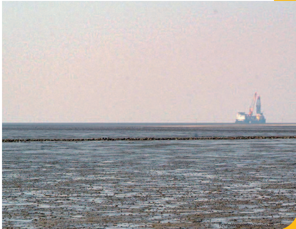
Auch im Watt wird nach Öl gebohrt

Auch sonst sind viele Fragen rund um die Rohstoffförderung im Meer offen und meine Nachfrage an die Bundesregierung hat die Defizite deutlich gemacht: Die Haftung von Konzernen bei Katastrophenfällen ist unzureichend. Schon für Atomunfälle ist die Deckungsvorsorge – also eine Art Fonds, aus dem Kompensationen geleistet werden können – viel zu gering. Für Ölunfälle ist sie gar nicht vorgeschrieben. Dazu macht die Antwort klar: Bisher gibt es nur Regelungen für Ölunfälle auf Schiffen – für Ölplattformen jedoch nicht. Im Falle einer Katastrophe kann es damit passieren, dass entweder niemand oder letztendlich der Steuerzahler zahlt. Mit den jetzigen Regelungen besteht ein Anreiz, die Plattformen von Subunternehmen betreiben zu lassen. Diese könnten die Gewinne abführen und im Schadensfall