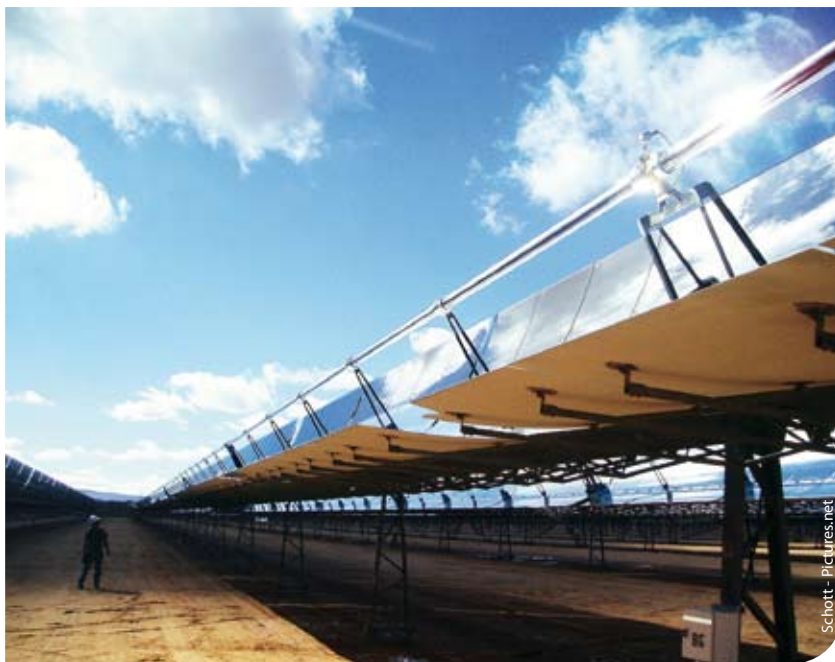
Großräumige Versorgung durch Solarenergie machen Kohlekraftwerke überflüssig, und am Atomausstieg müsste nicht gerüttelt werden.

Die Netze sind also von entscheidender Bedeutung für den Ausbau der Erneuerbaren Energien. Das Stromnetz wird allerdings heute von den Strom-Oligopolisten zur Erlangung von Wettbewerbsvorteilen im Bereich der Stromerzeugung und des Handels mit Strom missbraucht. Das Eigentum der Stromnetze in der Hand der Stromgiganten führt zwangsläufig zu einer Eigenbegünstigung. Daher müssen die Strom-