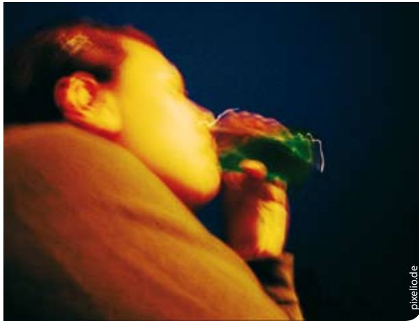
Wir brauchen mehr Verantwortung und mehr Problembewusstsein

Presseberichte über Alkoholexzesse und planmäßiges Komasaufen schrecken die Erwachsenen auf. Insbesondere Eltern und LehrerInnen reagieren betroffen: „Wie konnte das passieren? – Hoffentlich sind meine Kinder anders drauf! – Es muss etwas getan werden!“