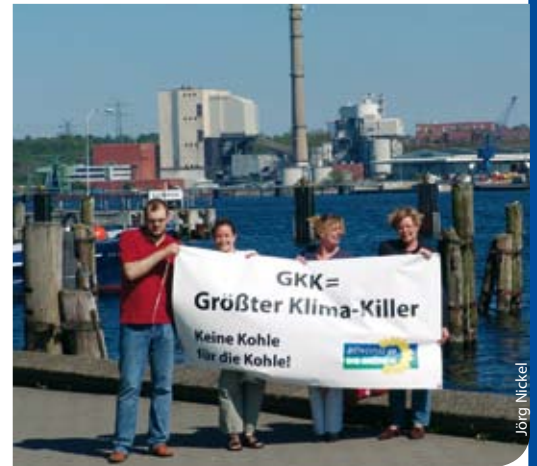
Überall im Land haben Grüne Klimaaktionstage organisiert

netze in das Eigentum der öffentlichen Hand überführt werden. Nun muss dieser Weg „nur“ noch politisch beschrritten werden. Die Beharrungskräfte sind allerdings riesig, denn in der