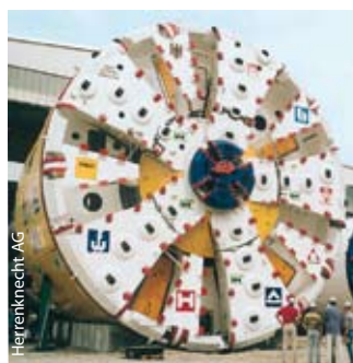
Tunnelbaumaßnahmen werden oft als ÖPP geplant

Die Grüne Landtagsfraktion hat sich entschlossen, einem ÖPP-Gesetz zuzustimmen, wenn folgende Spielregeln festgeschrieben werden: Vor der Zustimmung für ein ÖPP-