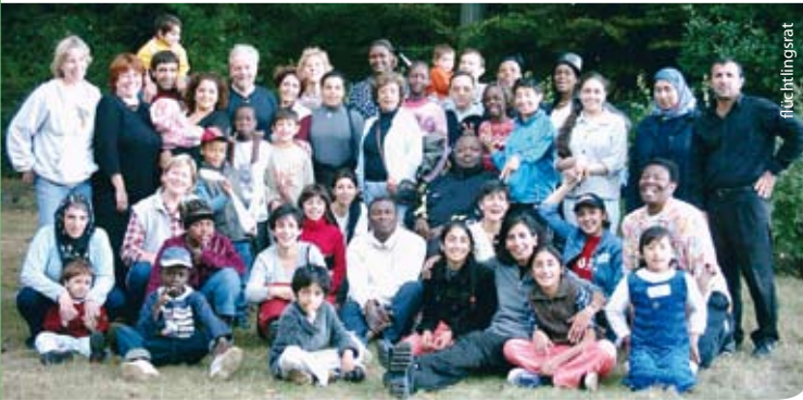
Deutschkenntnisse sind zwingend, aber finanzieren können Flüchtlinge diese Kurse oft nicht

Auf Landesebene stehen wir in engem Kontakt zum Flüchtlingsrat, um Kooperationen bei drohenden Abschiebungen vorzubereiten. Wir brauchen ein humanes Bleiberecht, das eine Brücke in unserer Gesellschaft schafft! Interesse mitzuarbeiten? Dann meldet euch! ●