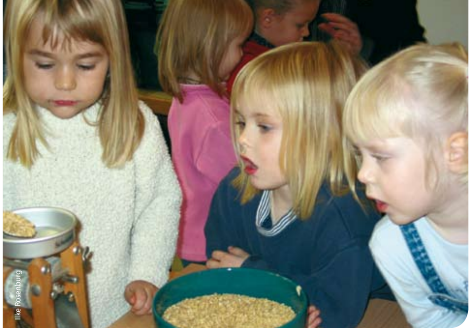
Unsere Zukunft isst und lernt in Kita und Schule