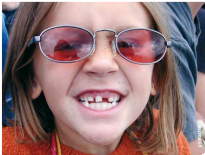
Wir Grüne wollen lückenlos die beste Bildung – von Kita bis zur Universität

Aber wirklich Mut haben bislang nur die Fehmarnbewohner bewiesen. Sie bauen ihr Gymnasium zur Gemeinschaftsschule für alle Kinder um. Sie wollen, dass auf der Insel wie in Finnland über 50 Prozent ihrer Kinder Abitur machen, damit trotz Rückgang der Bevölkerung Fehmarn seine gymnasiale Oberstufe behalten kann.