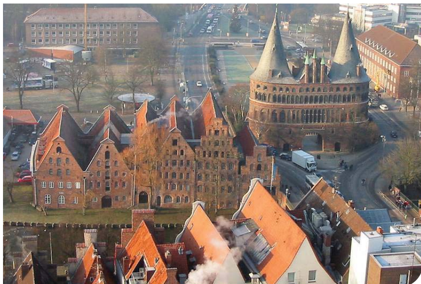
Der nächste Kulturbesuch findet im weihnachtlichen Lübeck statt