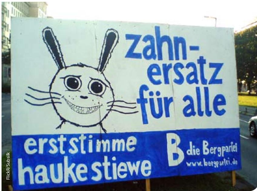
Wir wünschen uns eine lebendige Demokratie

Angebote zu machen, die die WählerInnen überzeugen. Umgekehrt wird also ein Schuh daraus: Statt sich in den Elfenbeinturm nicht transparenter Entscheidungen zurückzuziehen soll sich die SPD mehr Mühe geben. Wahlkämpfe bieten eine ideale Gelegenheit, politische Programme und persönliche Fähigkeiten zu kommunizieren und im Dialog mit den BürgerInnen zu überprüfen. Sich dieser Auseinandersetzung unter dem Vorwand der geringen Wahlbeteiligung zu entziehen, zeugt von mangelndem Demokratie-