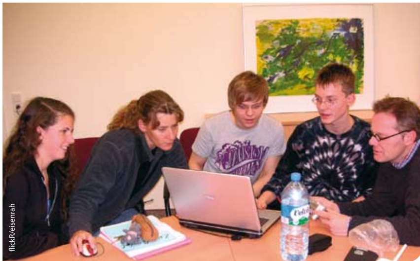
Das Schulsystem in Schleswig-Holstein ist in Bewegung geraten – darauf können wir stolz sein